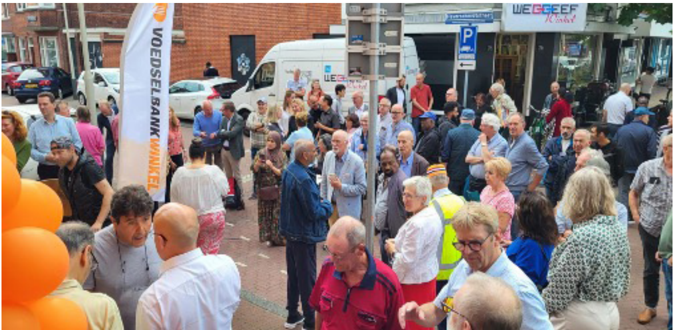
Foto: Opening winkel Laak.